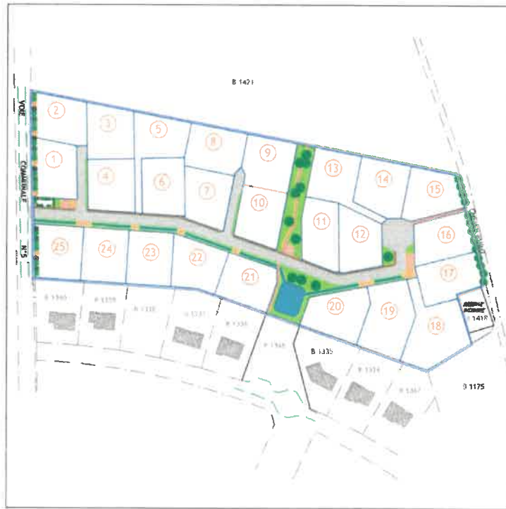
PLAN D'ENSEMBLE ECHELLE 1/2000